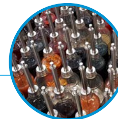
染化料多管路 滴液系统 带独立不锈钢 移液管的液体 玻璃瓶