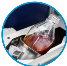
母液瓶自动清洗机